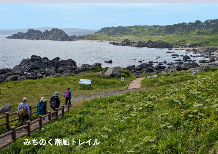
みちのく潮風トレイル

旅行日程：2025年6月12日(木)～14日(土) 旅行代金：72,000円(釜石駅集合・八戸駅解散) 定員：15名様(最少催行10名様) 添乗員：同行します 宿泊：下記または同等クラス (釜石)宝来館 (八戸)八戸グランド ※釜石は4人部屋、八戸は2人部屋が基本 バス会社：三八五バス (6/14のみ) 申込締切：5月2日(金) ※定員次第締切