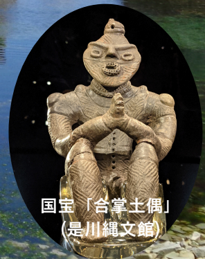
国宝「合掌土偶」 (是川縄文館)